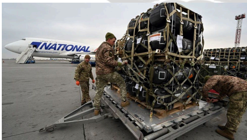
Немецкие солдаты готовят боеприпасы для отправки в Украину

После аннексии Крыма Россией в 2014 году НАТО заняло твердую позицию в полной поддержке территориальной целостности Украины. НАТО также осуждает попытку России аннексировать четыре украинские области — Донецкую, Луганскую, Херсонскую и Запорожскую — в сентябре 2022 года. После аннексии Крыма Россией в 2014 году НАТО помогла реформировать вооруженные силы и оборонные институты Украины, включая предоставление оборудования и финансовую поддержку, а также обучение десятков тысяч украинских солдат.